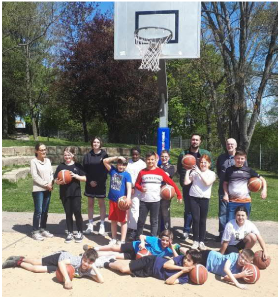
MLK Ostern 2022 Basketball Camp der NMB

Gerade in den letzten Jahren waren Schulmannschaften des Marie-Luise-Kaschnitz Gymnasiums und des Warndtgymnasiums aus Völklingen besonders erfolgreich und konnten als Landessieger nach Berlin fahren um das Saarland bei „Jugend trainiert für Olympia“ zu vertreten.